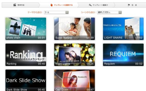
▲アプリケーション画面

本アプリケーションは、企業による商品プロモーション動画や、店舗のメニュー・スタッフ紹介動画、イベントのプロモーション映像といった、動画をつかった販促や集客施策にこれまで大きな費用をかけることが出来なかった利用者向けに、安価かつ・手軽に施策を行えるよう、「商品プロモーション」「オススメランキング」「店内雰囲気アピール」「ユニークな店員アピール」といった目的別に、「テンプレート」と呼ばれる、ストーリーをあらかじめ用意しています。