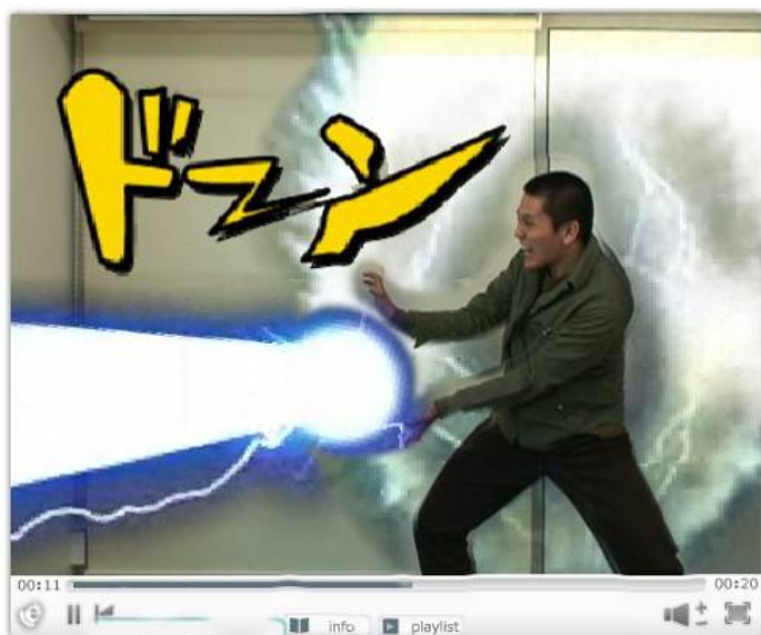
利用例 1: 波動ビームが打てる！？オモシロムービー