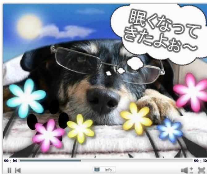
利用例 2: 愛犬主人公のオリジナルムービー