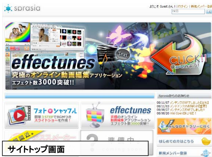
サイトトップ画面